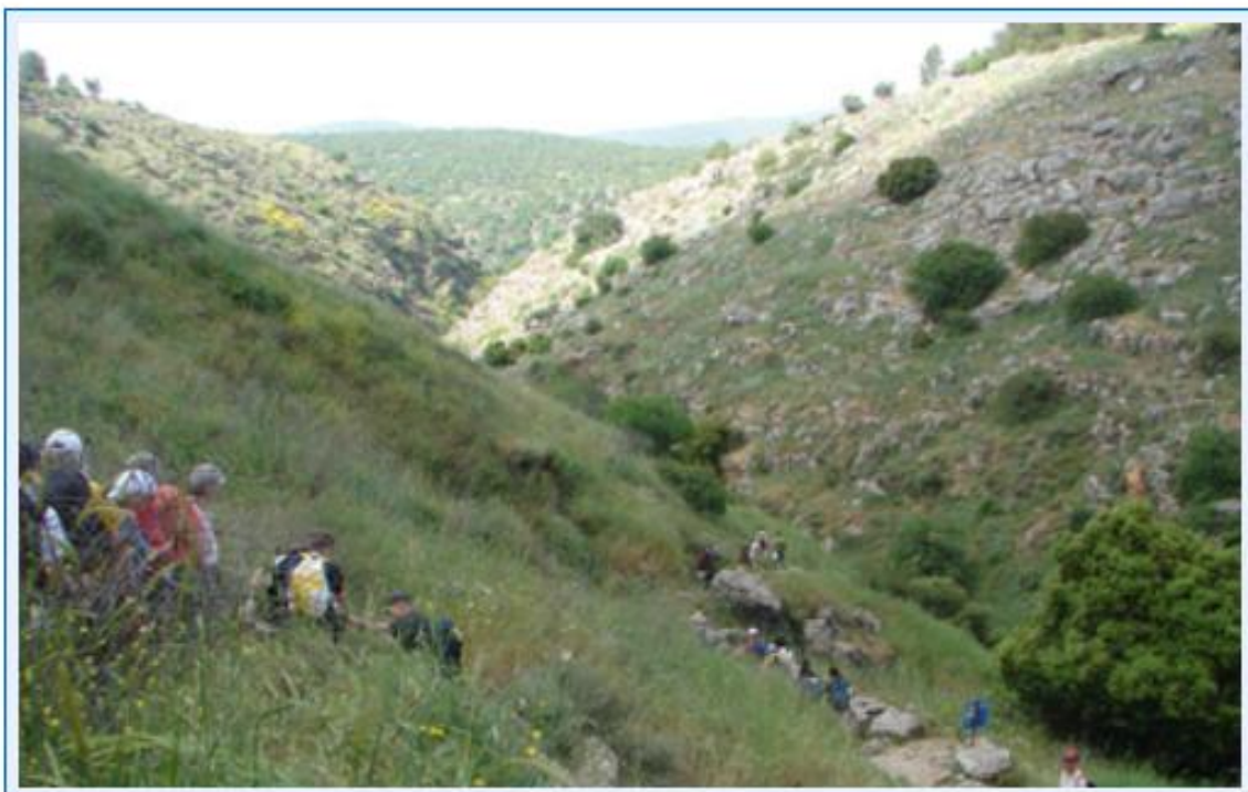
30 Wandern im Wadi Amud