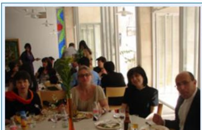
12 Festessen zu Ostern im Restaurant des Begegnungszentrums