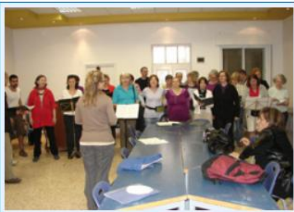
3 Chorprobe nach der Ankunft, zusammen mit dem Chor aus Bethlehem.