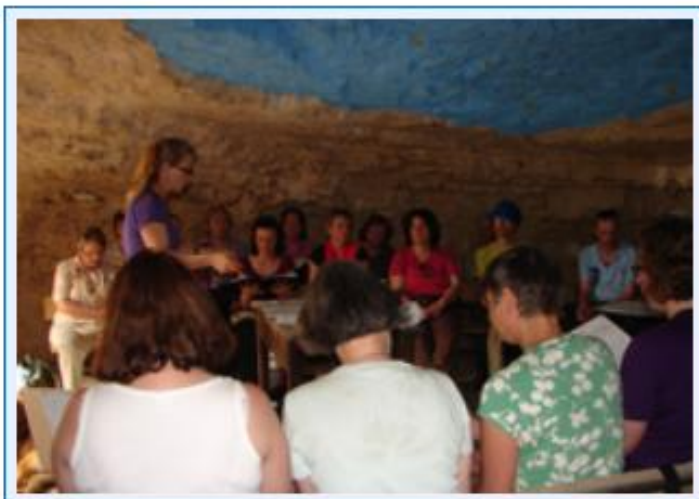
6 Singen in der Grotte auf Daouds Weinberg