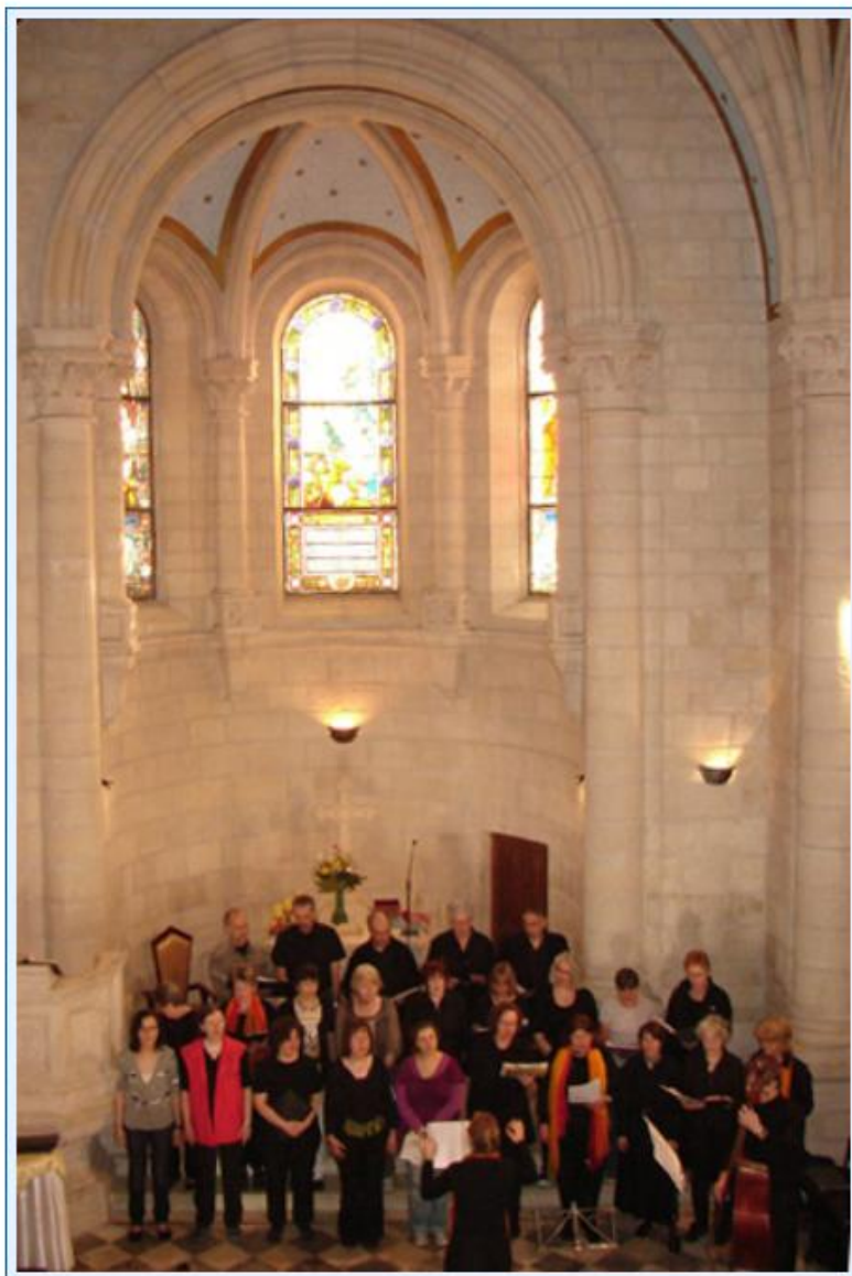
9 Der Gospelchor wirkte im Festgottesdienst der Weihnachtskirche mit.