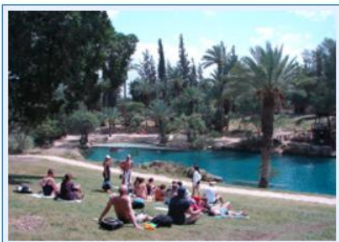
37 Erholung in Sachne