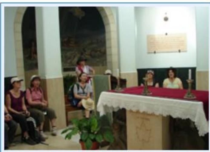
17 Singen in der Kirche auf den Hirtenfeldern