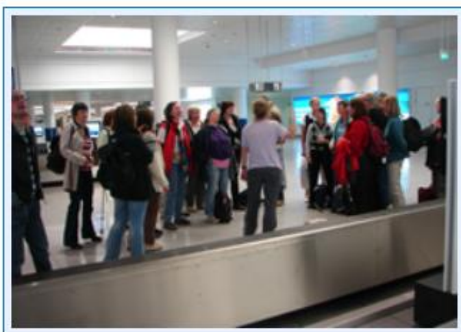
40 Lied zum Abschluss am Flughafen in München