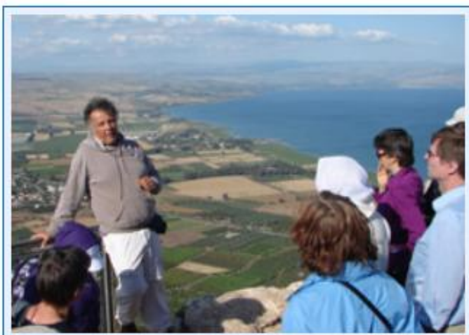
38 Am Arbel über dem See Genezareth