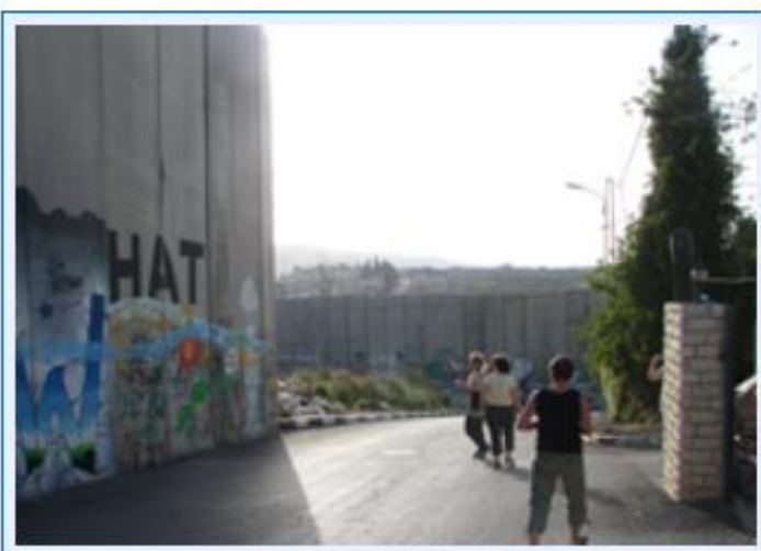
18 An der Mauer, die auch innerhalb Bethlehems ist, weil Israel sich den Zugang zum Rahels Grab durch die Mauer sichert.