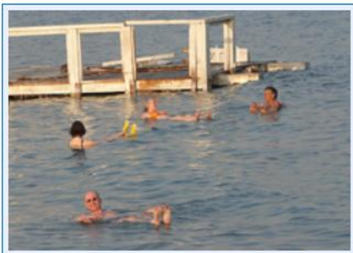
29 Im Toten Meer