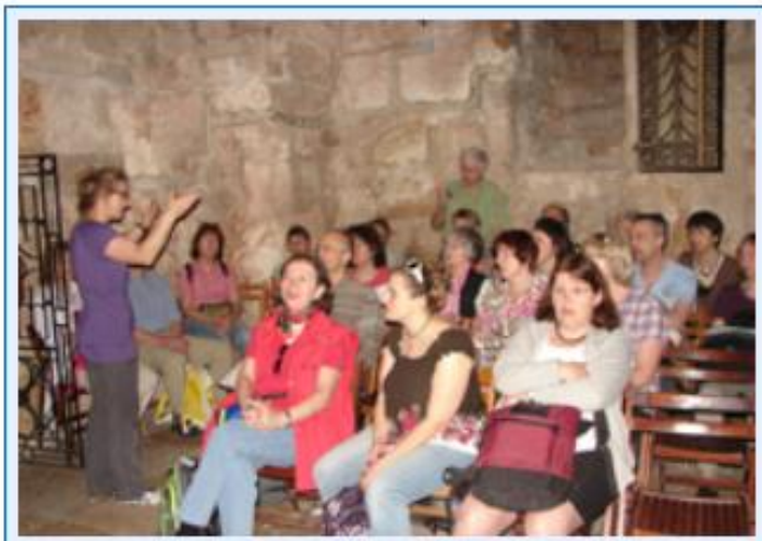
5 Singen in einer Grotte unter der Geburtskirche