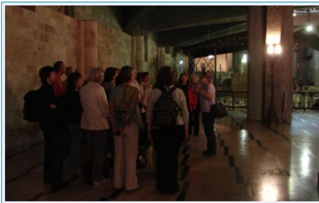
39 Auftritt in der Verkündigungskirche in Nazareth