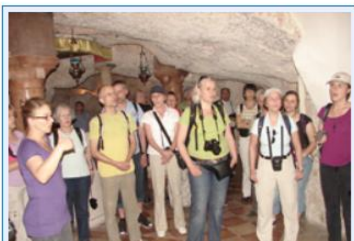
7 Singen der Milchgrotte in Bethlehem