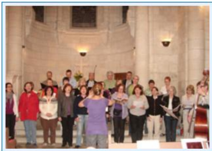
Probe in der Weihnachtskirche